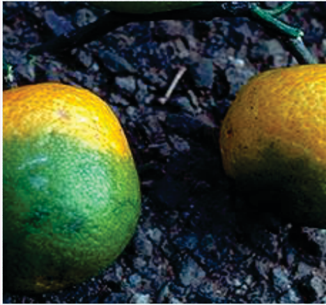
फलमा देखिने लक्षण