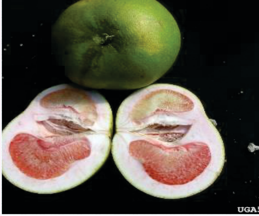
फलमा देखिने लक्षण